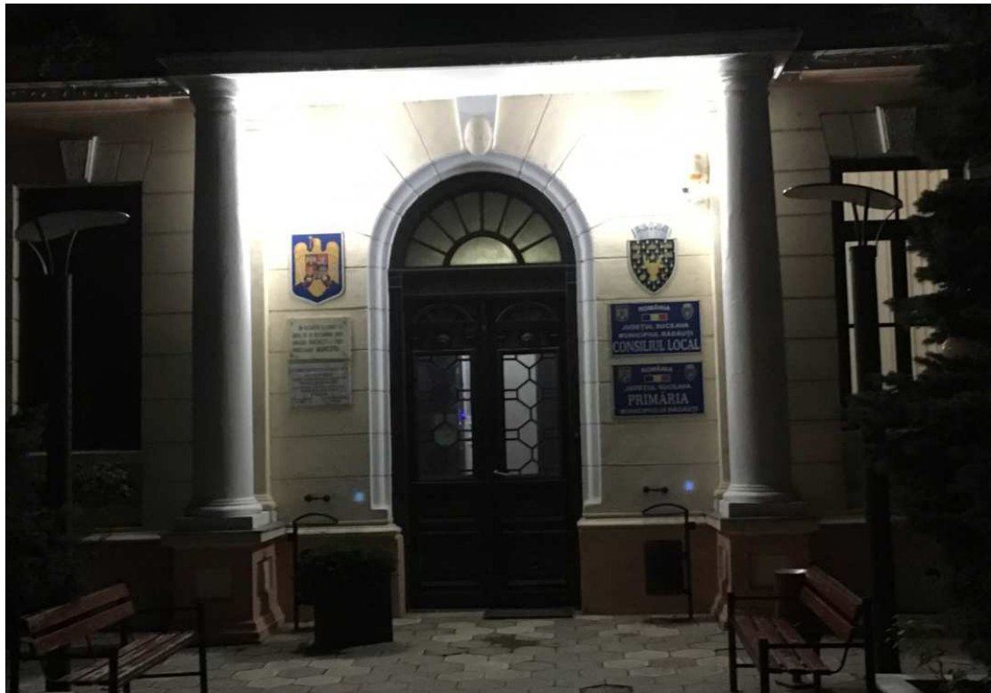
הכניסה לבית הכנסת ברדאוך, בית הכנסת בו התפללתי בילדותי